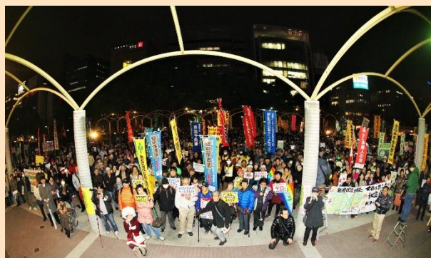
2013年12月6日 名古屋・栄