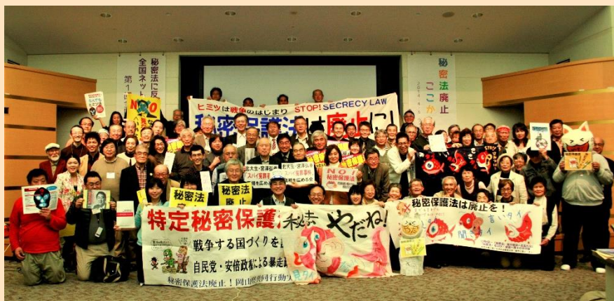
2014年4月6日 第1回全国交流集会 @名古屋