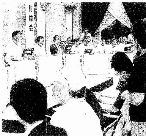
木曾川水系導水路計画についての公開討論会で市民の意見を聞く河村市長ら